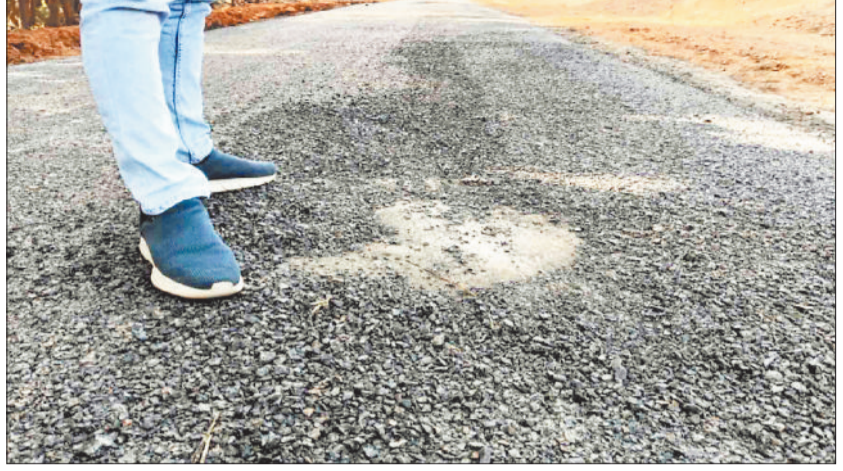
गुणवत्ताहीन नवनिर्मित सड़क।

लंबे समय से जर्जर सड़क की दशा झेल रहे ग्रामीणों की परेशानी कम होने का नाम नहीं ले रहा। आ ल म यह है कि करोड़ों की लागत से सड़क बनाई जा रही है कि न गुणवत्ता पर ध्यान नहीं दिया जा रहा। हैरानी की बात तो यह है कि सड़क बने अभी कुछ ही दिन हुए कि अब सड़क उखड़ने लगी है। ऐसे में सहज ही अंदाजा लगाया जा सकता है कि नवनिर्मित सड़क कितना टिकाऊ है। बनने के बाद सड़क के उखड़ जाने से क्षेत्र के ग्रामीणों में काफी आक्रोश है। प्रधानमंत्री जनमन कार्य योजना के तहत पटना भण्डारपारा से नवापारा तक लगभग 5.90 किलोमीटर लंबी सड़क का निर्माण कराया गया है। इस सड़क निर्माण के लिए करीब 3 करोड़ 63 लाख 12 हजार रुपए की राशि स्वीकृत की गई है, लेकिन निर्माण के कुछ ही समय